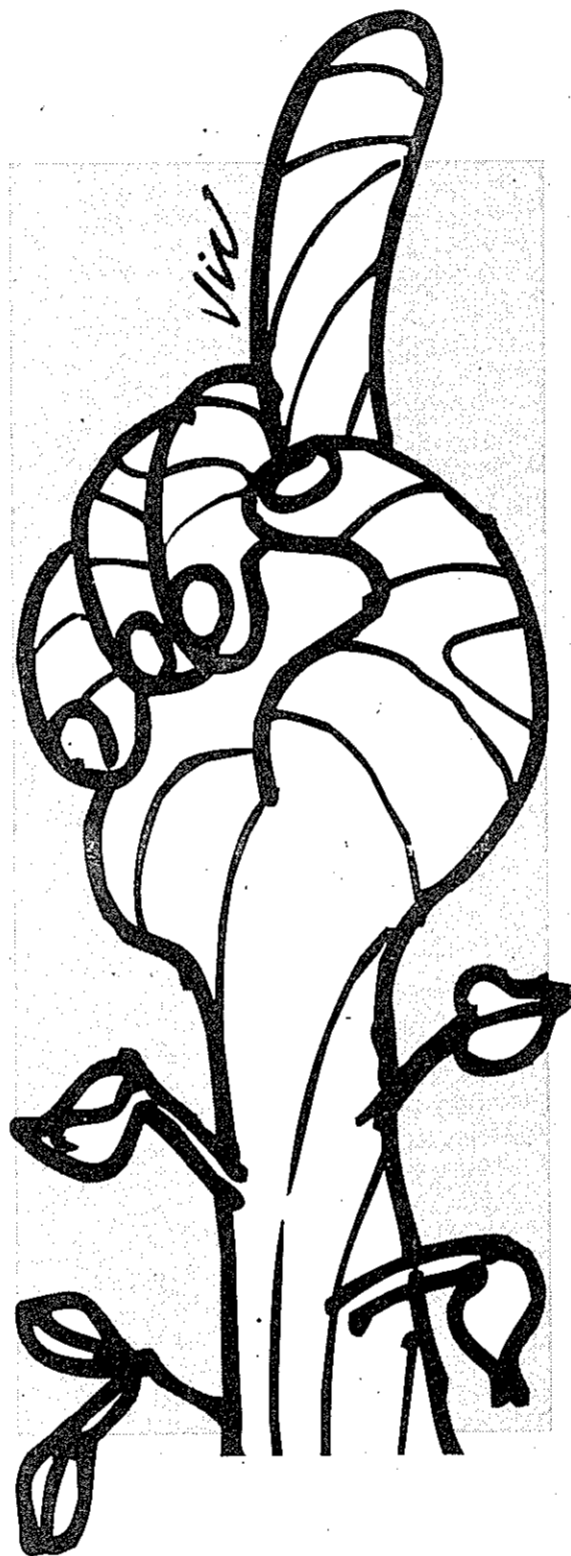
El autor es artista